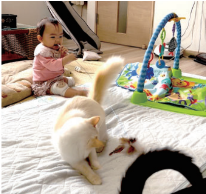
羽のおもちゃで猫使い

生まれてすぐの頃は、目を離すと噛みついたり引つ掻いたり上に乗ったりしないかと心配しました。だけどそれは取り越し苦労で、赤ちゃんとお猫の相性は最高でした！ 最初、猫はみんな赤ちゃんに興味津々。「なんだ！この生き物は？」と言うかのように、代わる代わる近づいて、クンクンにおいをかいで確かめたりするのですが、誰も、攻撃しようとはしません。みんな、優しく守ってあげないといけない、何か、弱い存在なんだ、ということには分かっているようです。