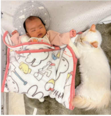
添い寝するミルク

今年の2月に娘が生まれました。我が家には猫が4匹いて、産後1か月は猫と一緒に実家に帰って過ごしたのですが、実家には当時、保護猫含めて8匹、なので、合計12匹の猫がいました。